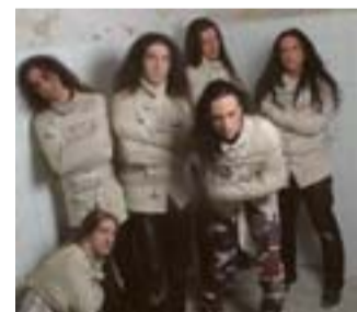
La band dei Labyrinth