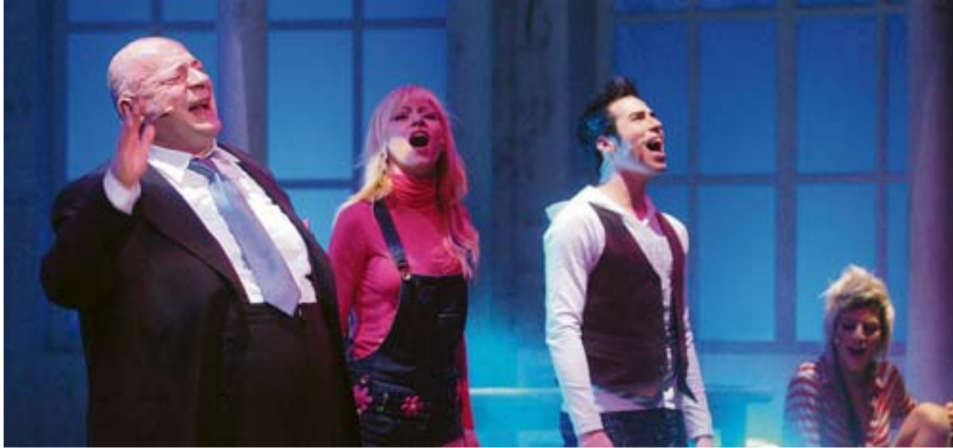
Da sinistra, Maurizio Coruzzi in arte Platinette e altri interpreti del musical «A un passo dal sogno». Stasera l'ultima replica

DIVERTIAMOCI A TEATRO. UN MUSICAL RITAGLIATO SUI TEMPI E I MODELLI DELLA TELEVISIONE