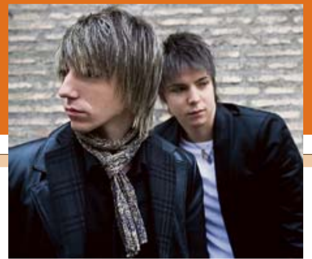
I Sonohra, il duo composto dai fratelli Luca e Diego Fainello

Per inviare segnalazioni di eventi alla redazione Cultura e Spettacoli utilizzare il seguente indirizzo email: culturaspettacoli@arena.it