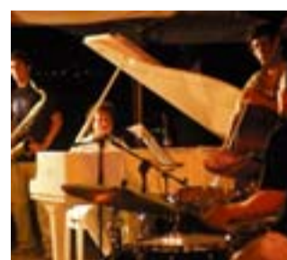
Il Baobab in versione quartetto