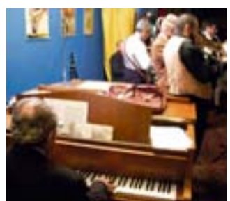
L'Original Perdido Jazz Band

Un fine settimana al Time Out all'insegna della musica metal-rock dal vivo. Domani sera saranno sul palco del locale in